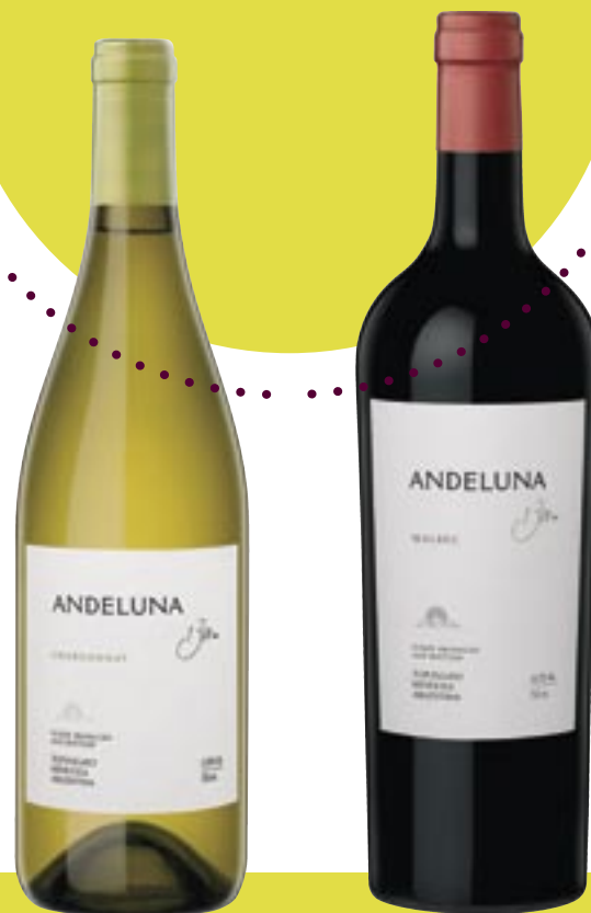
Andeluna Cellars, Chardonnay: Varenr. 862095