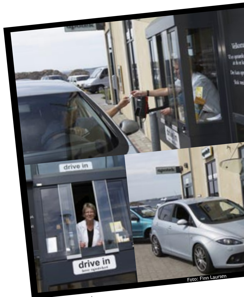
Thisted Løve Apotek

Hun tilføjer, at det er folk med syge børn, der roser initiativet mest. ”Ofte har de lige været ved lægen, som ligger her ved siden af, og kan køre direkte over til os og hente medicinen uden at tage børnene ud af bilen.” ■