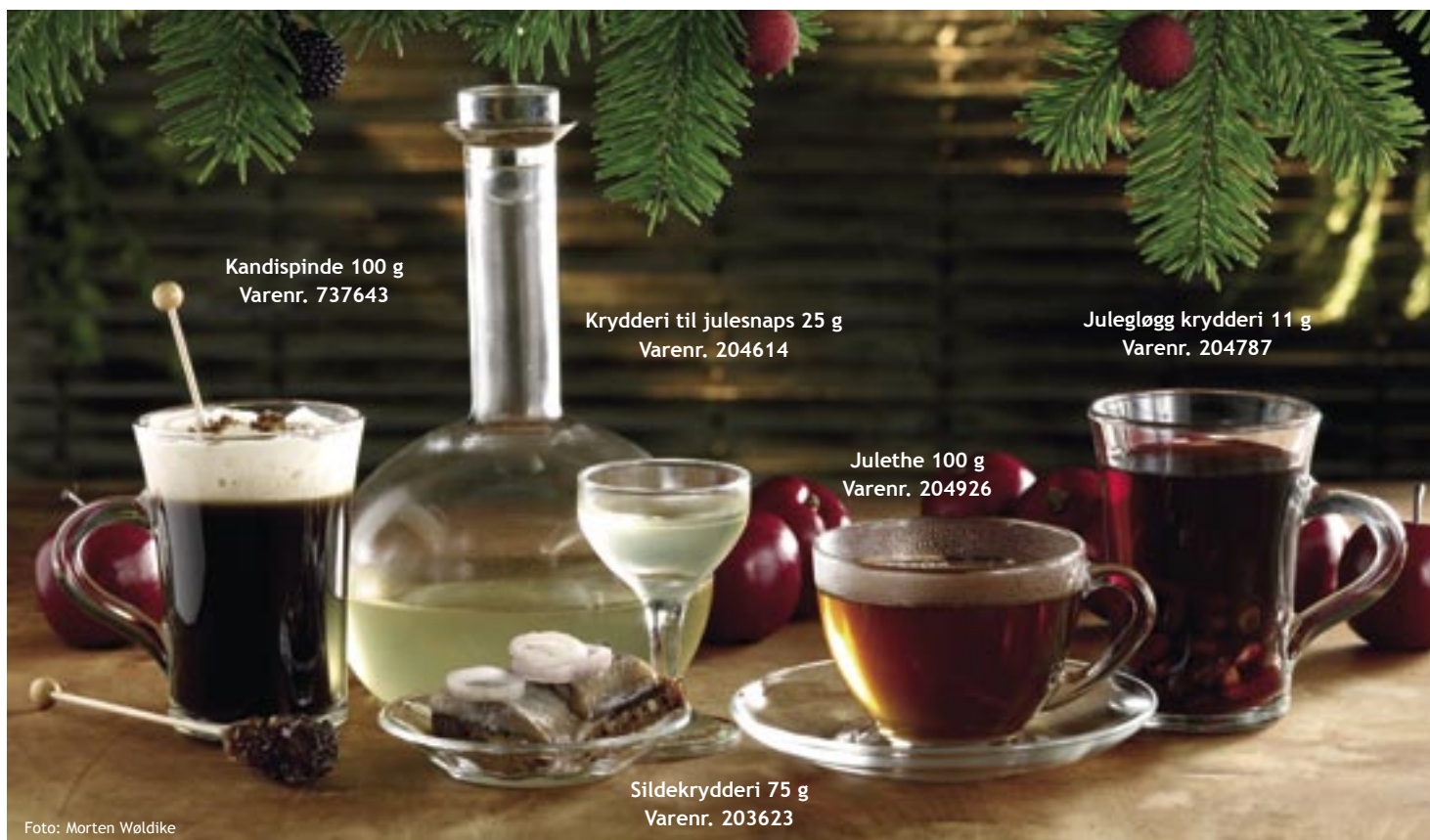
Kandispinde 100 g Varenr. 737643